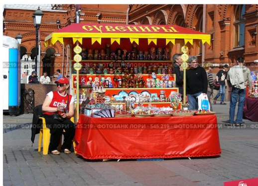
Торговля сувенирами на Манежной площади в Москве